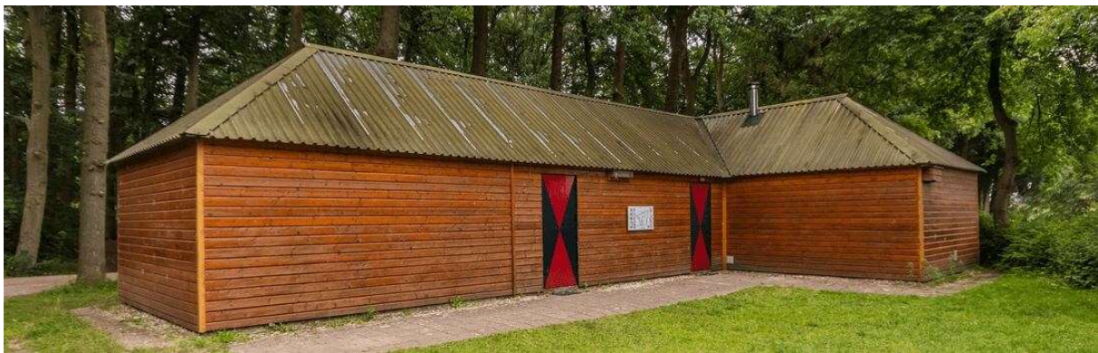
Blokhut "De Damlaan": bevers en welpen.

De geschiedenis van de groep begint in de jaren dertig van de vorige eeuw, wij bestaan als scoutinggroep sinds 1934. Onze groep beschikt over twee blokhutten. Eén aan de rand van Zutphen en de andere in een bos in Gorssel. Voor elke leeftijdsgroep is er een speltak met een spelaanbod dat speciaal gericht is op die leeftijdscategorie.