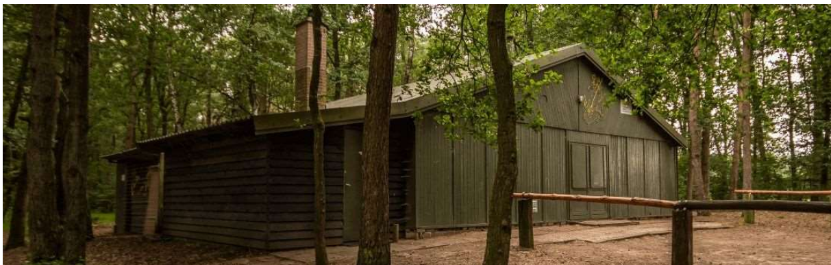
Blokhut "De Hei": scouts en explorers, stam